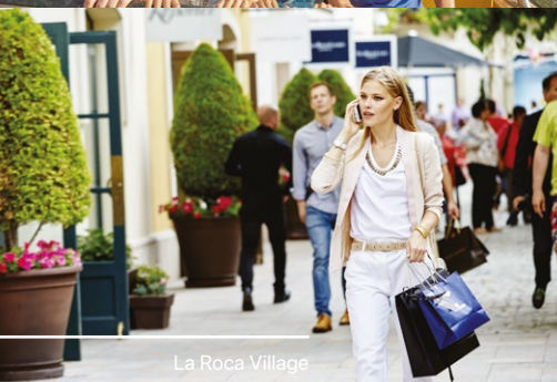
La Roca Village