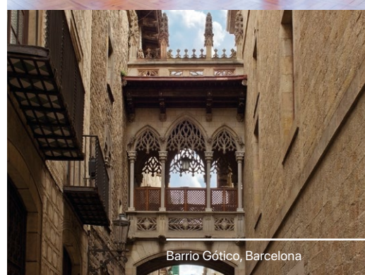
Barrio Gótico, Barcelona