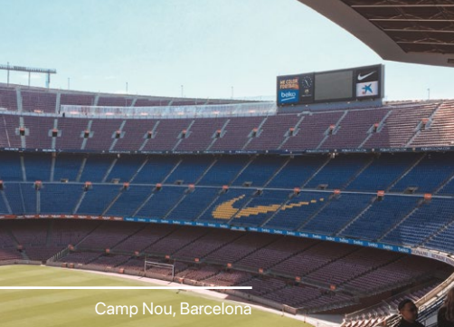
Camp Nou, Barcelona