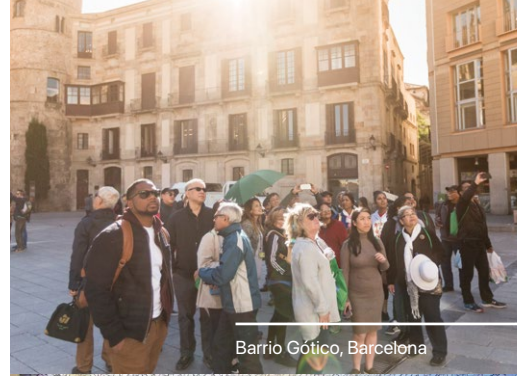
Barrio Gótico, Barcelona