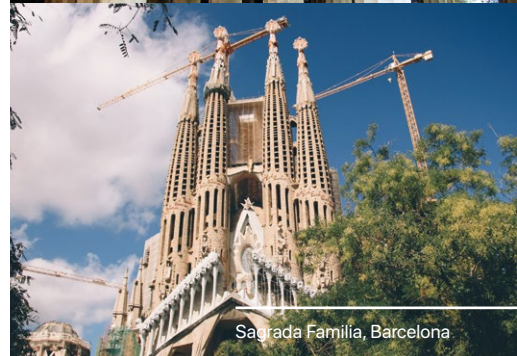
Sagrada Família, Barcelona