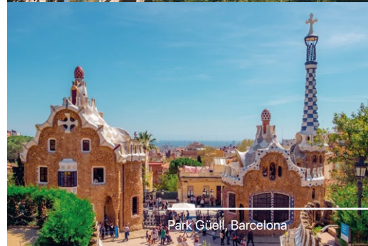
Park Güell, Barcelona