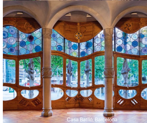
Casa Batlló, Barcelona