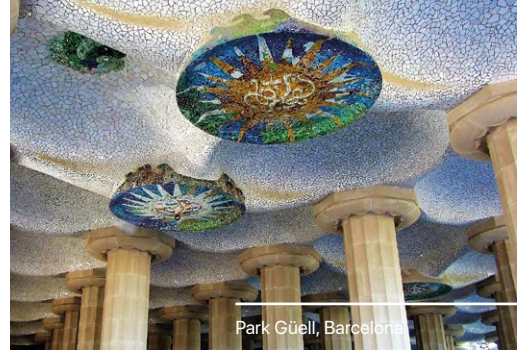
Park Güell, Barcelona