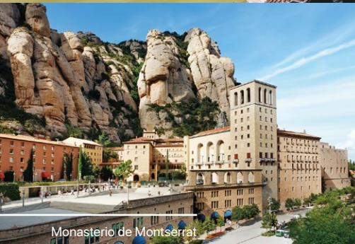
Monasterio de Montserrat