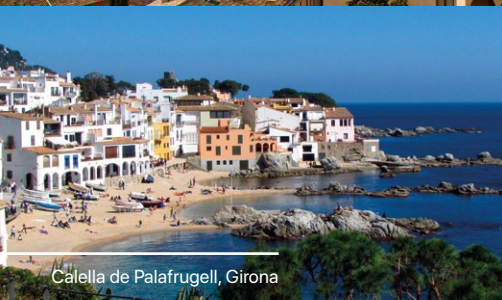
Callella de Palafrugell, Girona